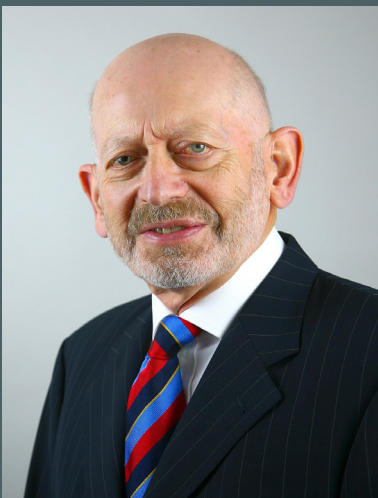
Douglas Bain CBE TD Comisiynydd Safonau'r Senedd

Prif gyfrifoldebau'r Comisiynydd Safonau yw cael cwynion am ymddygiad Aelodau o'r Senedd ac ymchwilio iddynt, cyflwyno adroddiadau i'r Senedd am ei ymchwiliadau, a rhoi cyngor i Aelodau o'r Senedd a'r cyhoedd am y gweithdrefnau gwyno.