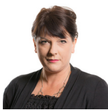
Rhianon Passmore AS Llafur Cymru