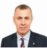
Adam Price AS Plaid Cymru

Roedd yr Aelod a ganlyn hefyd yn aelod o'r Pwyllgor yn ystod yr ymchwiliad hwn.