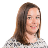
Vikki Howells AS Llafur Cymru