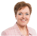
Dawn Bowden AS Llafur Cymru