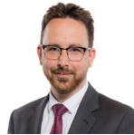
Hefin David AS Llafur Cymru