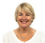
Siân Gwenllïan AS Plaid Cymru