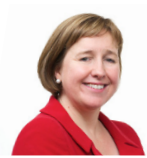
Lynne Neagle AS Llafur Cymru