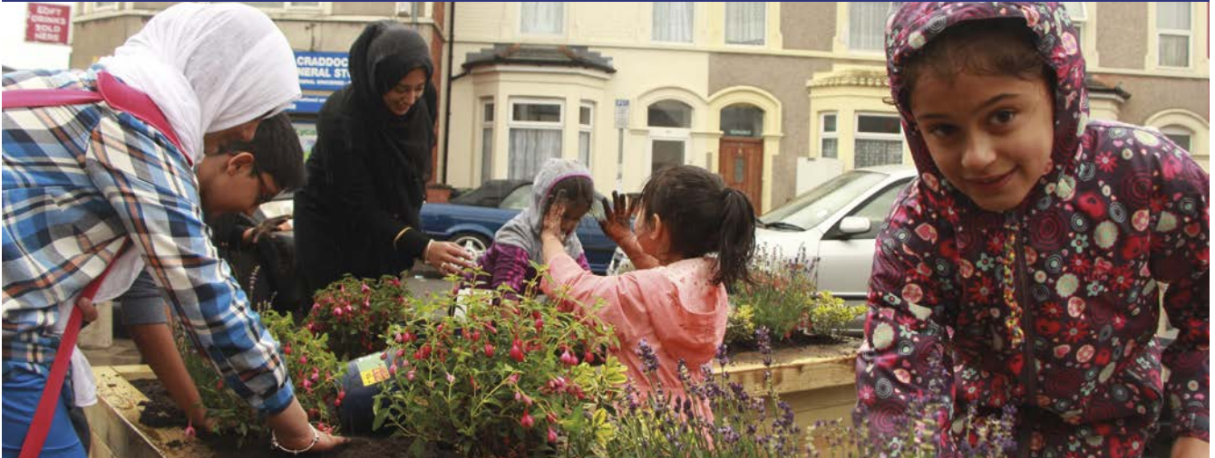
Prosiect Tyfu'n Wylt Treganna a Glan yr Afon

Mae asiantaethau Gofal a Thrwsio yn cynorthwyo pobl anabl a phobl hŷn i fyw'n annibynnol yn eu cartref eu hunain. Yn 2016/17 derbyniodd Gofal a Thrwsio £4.3 miliwn o gyllid gan Lywodraeth Cymru er mwyn cynorthwyo dros 27,000 o bobl hŷn yng Nghymru.