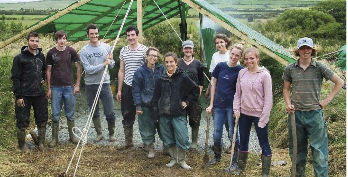
Gwirfoddolwyr yn dysgu sgiliau meithrin tîm

Mae Tîm Diwygio Lles Llywodraeth Cymru wedi gweithio'n agos â'r Adran Gwaith a Phensiynau (DWP) i gael eglurder ynghylch y rheolau sy'n ymwneud ag annog pobl sy'n hawlio budd-daliadau lles i ymgymryd â gweithgareddau gwirfoddol fel un ffordd o'u helpu yn ôl i gyflogaeth neu i waith.