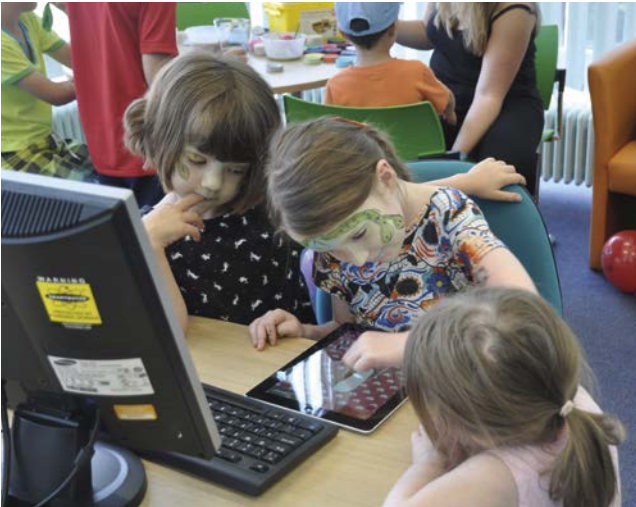
Llyfrgell Abertyleri, Ymddiriedolaeth Aneurin Leisure

Mae Llywodraeth Cymru yn dyrannu cyllid "craidd" i leihau unrhyw gostau gweinyddol er mwyn helpu i wneud Cefnogi Trydydd Sector Cymru yn fwy effeithlon.