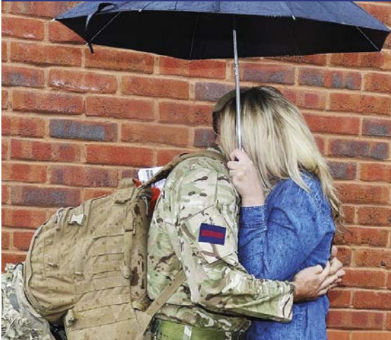
Aelod o'r Lluoedd Arfog yn dychwelyd at ei deulu