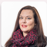
Vikki Howells AS Llafur Cymru

Mynychodd yr Aelod a ganlyn fel dirprwy yn ystod yr ymchwiliad hwn: