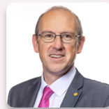
Llyr Gruffydd AS Plaid Cymru