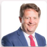
Alun Davies AS Llafur Cymru