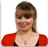
Cadeirydd y Pwyllgor: Delyth Jewell AS Plaid Cymru