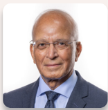
Altaf Hussain AS Ceidwadwyr Cymreig