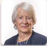
Cadeirydd y Pwyllgor: Jenny Rathbone AS Llafur Cymru