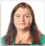
Sioned Williams AS Plaid Cymru

Roedd yr Aelod a ganlyn hefyd yn aelod o'r Pwyllgor yn ystod yr ymchwiliad hwn: