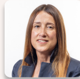
Jane Dodds AS Democratiaid Rhyddfrydol Cymru