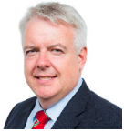
Carwyn Jones AS Llafur Cymru