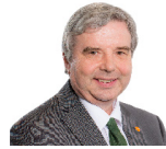
Dai Lloyd AS Plaid Cymru