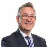
Mick Antoniw AS Llafur Cymru