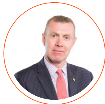
Adam Price AC

Rydym wedi parhau i adeiladu ar y gwaith da a wnaed yn ystod y Pedwerydd Cynulliad, i ddysgu gan eraill a rhannu arbenigedd lle bo hynny'n bosibl. Wrth inni ddod â'r Cynllun presennol i ben a gweithredu Cynllun Ieithoedd Swyddogol newydd ar gyfer y Pumed Cynulliad, sy'n adeiladu ar y gwelliannau a gyflwynwyd hyd yma, rydym yn hyderus y gallwn gadarnhau ein henw da fel sefydliad gwirioneddol ddwyieithog sy'n arwain y ffordd mewn darparu gwasanaeth dwyieithog yng Nghymru.